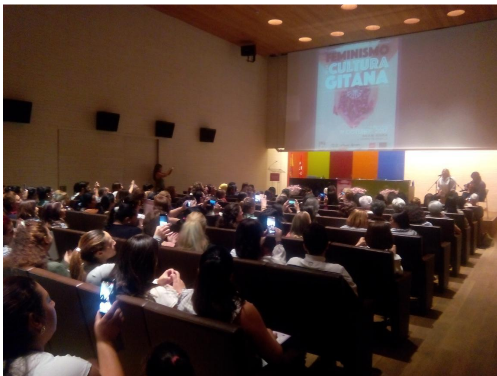
ACTUACIÓN DE NOELIA HEREDIA "LA NEGRI" AL COMIENZO.